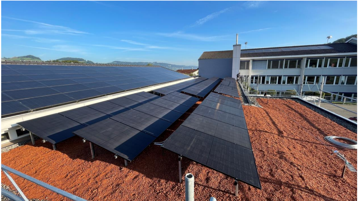
Flachdachsanieerung und Neubau Photovoltaikanlage auf dem Pausendach